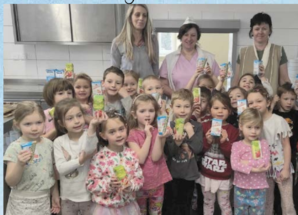
Návštěva v kuchyni