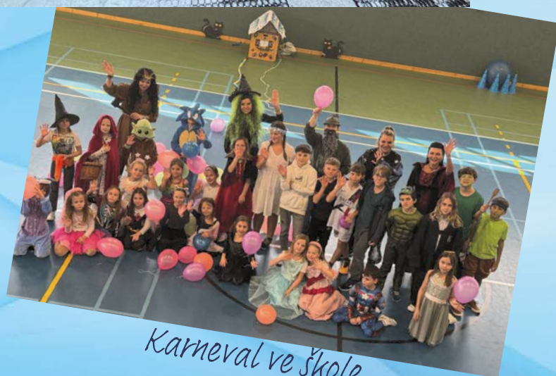
Karneval ve škole