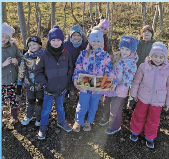
Něco do krmelce