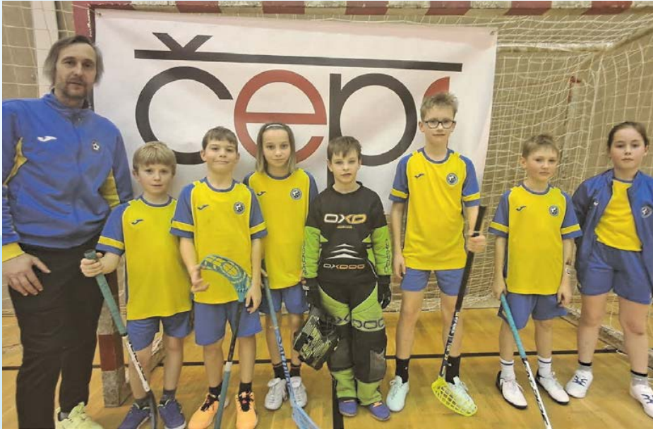
Krajské kolo ve florbale