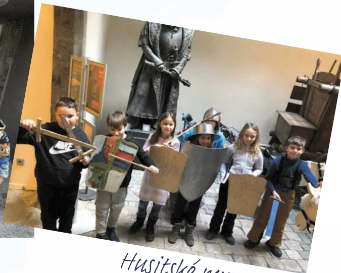
Husitské muzeum Otužování