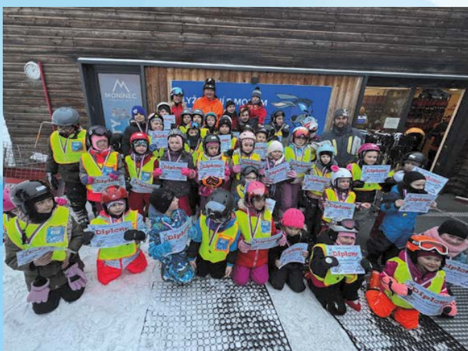
Lyzování na Mořinci