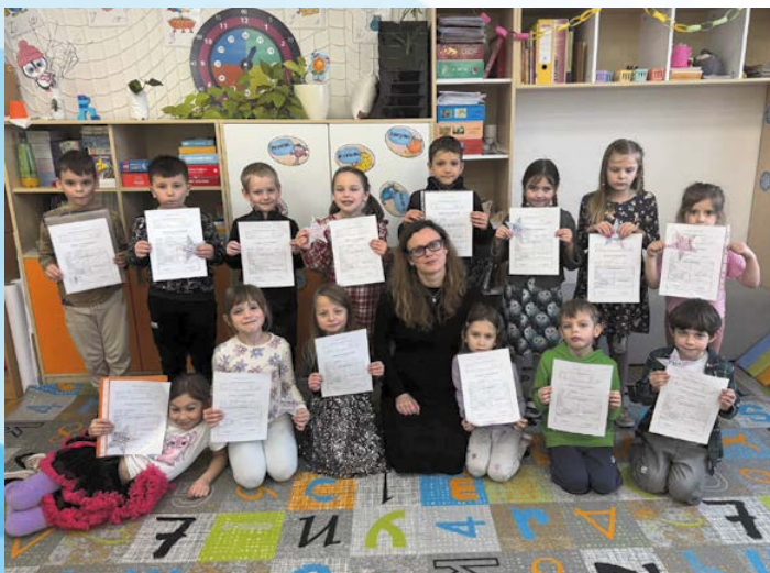
První vysvědčení v první třídě