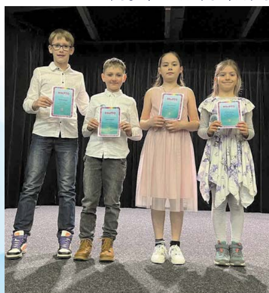
Okresní kolo recitace