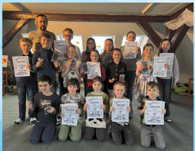
Školní kolo recitace