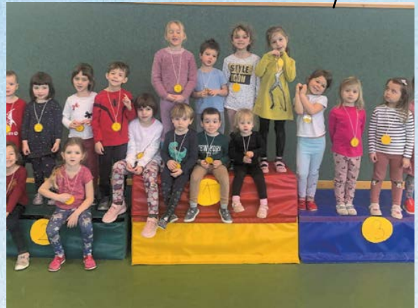
Sportování v hale