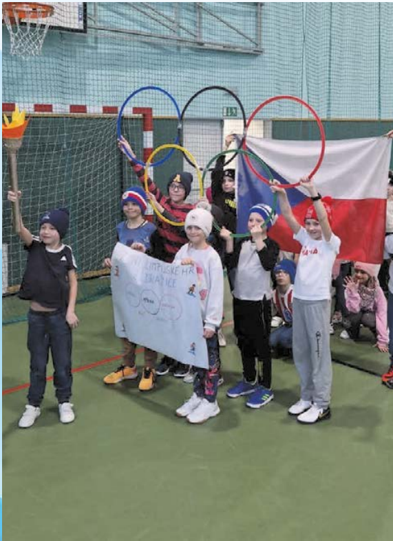
Zimní olympijské hry