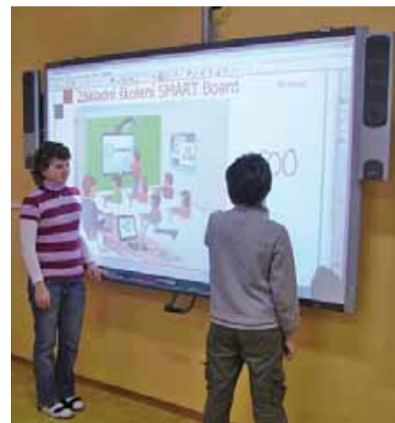
Nová interaktivní tabule

situace se snažíme řešit co nejlépe, aby nebyla snížena kvalita výuky a výchovy našich žáků.