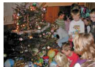
Ježíšek v MŠ