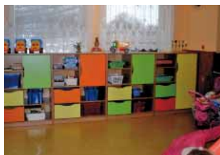
Nová nábytková stěna